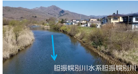
河道掘削、樹木伐採（胆振総合振興局）