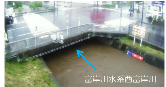
簡易型河川監視カメラによる映像提供（胆振総合振興局）