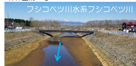
河道掘削、樹木伐採（胆振総合振興局）