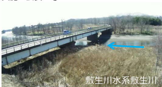
敷生川水系敷生川