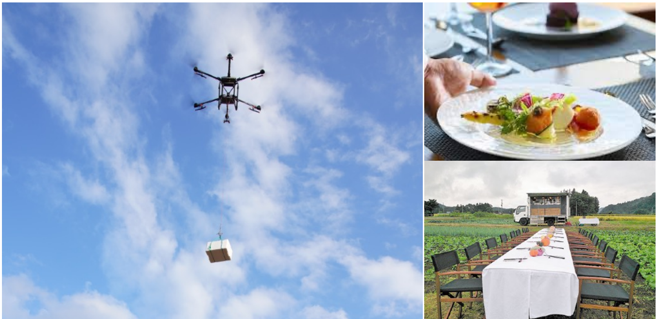
短距離物流用ドローン（苗木運搬ドローン）を活用して料理を配送

報道関係各位様には、是非とも「ドローンフレンチ配送実証実験」に注目していただき、取材いただけるようご協力の程、宜しくお願いたします。