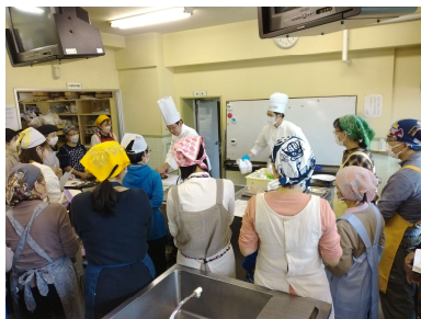
前回(令和5年10月28日)のクッキング スクール