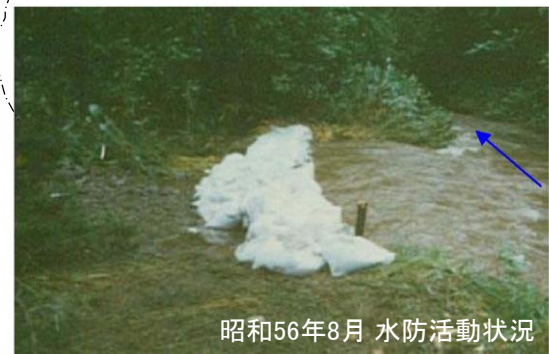
昭和56年8月 水防活動状況