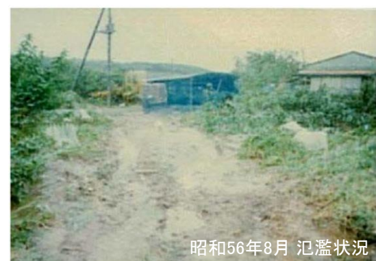
昭和56年8月 氾濫状況