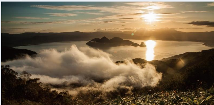
① 洞爺湖有珠山ジオパーク