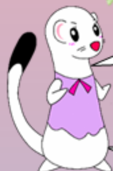
北海道労働委員会 公式マスコット「ジュリちゃん」

賃金未払、解雇、パワハラといった職場のトラブルにお悩みの方が 気軽に利用できる制度です。