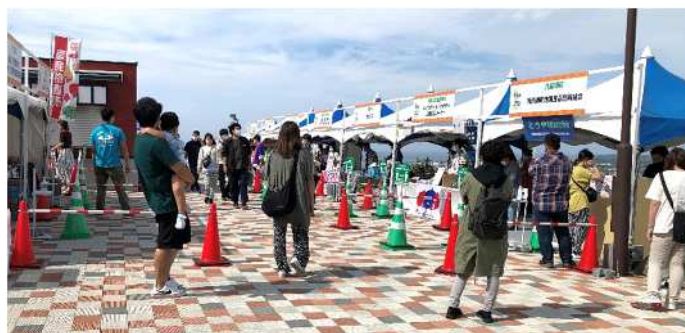
令和4年度実施の様子