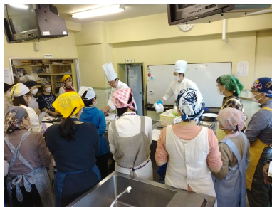
前回(令和5年10月28日)のクッキ ングスクール