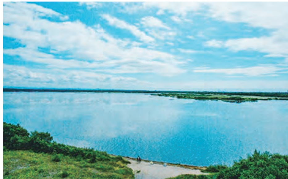
ウトナイ湖(苫小牧市)