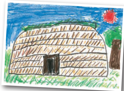
2023年版いぶり縄文カレンダー採用作品

「北海道・北東北の縄文遺跡群」の世界遺産登録2周年を記念して、「あなたが思う縄文（縄文遺跡）について」をテーマにカレンダーの原画を募集し、令和6年（2024年）版「縄文遺跡カレンダー」を作成します。