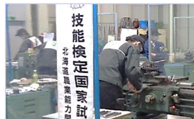
精密機械科：技能検定国家試験受検の様子