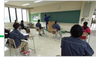
教室での講義受講の様子