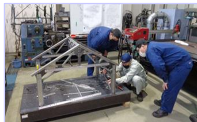
金属加工科：構造物組立実習の様子

精密機械科 … 自動車、航空宇宙、鉄道車両整備、精密金型製作といった関連企業の生産技術、設計、検査、設備保安などの様々な分野のエンジニア。 公務員（技術系）への就職を目指すことも可能。また、精密機械科修了後に北海道職業能力開発大学校への進学も可能。