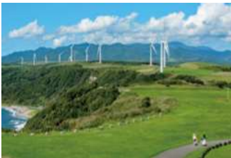
函館・江差自動車道「木古内・江差間」整備促進協議会 (せたな町) 観光情報の紹介