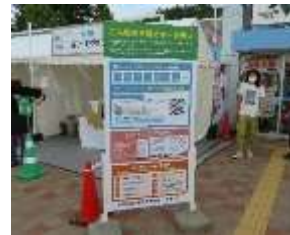
昨年度実施風景(砂川SA会場)

NEXCO 東日本グループでは、2021～2025年度までの期間を「SDGsの達成に貢献し、新たな未来社会に向け変革していく期間」と位置づけ、様々な取り組みを行っています。