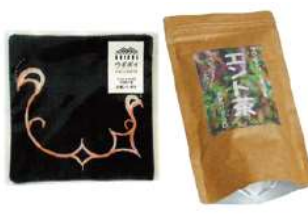
エコイココ/おみやげ舎イココ (胆振総合振興局) いぶりアイヌ・ウポポイ応援製品販売 ※9/17(土)のみ