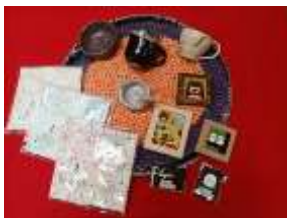
北海道社会福祉事業団 太陽の園 (伊達市) 地鶏有精卵等、特産品販売