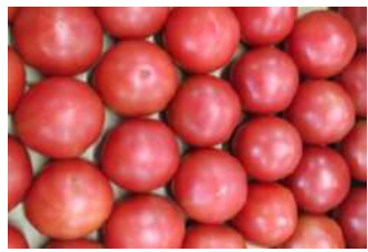
(有)そうべつフレッシュプラザ (壮瞥町) 野菜・果物・ジュース等販売