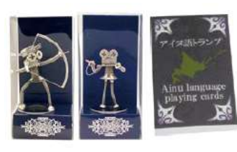
特定非営利活動法人テツプロ ポルタ工房/ことのは (胆振総合振興局) いぶりアイヌ・ウポポイ応援製品等販売 ※9/18(日)のみ