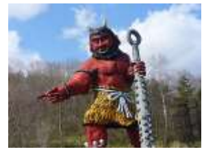
登別市 (登別市) 観光情報の紹介