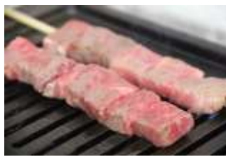
洞爺湖町地場産品協同組合 (洞爺湖町) 洞爺あか牛等販売