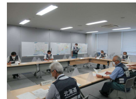
振興局防災訓練 (風水害想定)