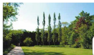
G イコロの森 苫小牧市