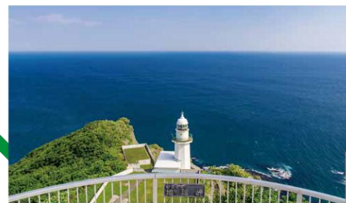
F 地球岬 室蘭市