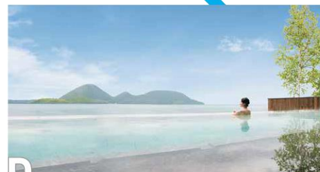
D 洞爺湖温泉 洞爺湖町・壮瞥町