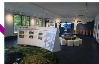
K だて歴史文化ミュージアム 伊達市