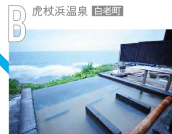
B 虎杖浜温泉 白老町