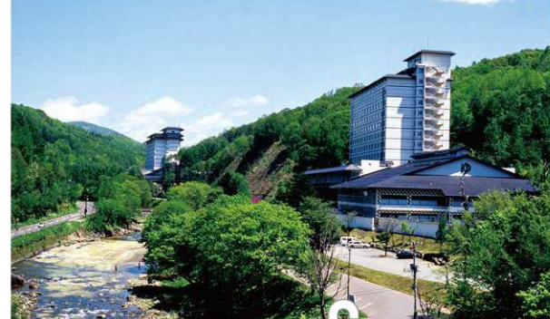
C 北湯沢温泉 伊達市