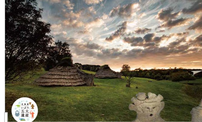
I 北海道・北東北の縄文遺跡群 伊達市・洞爺湖町