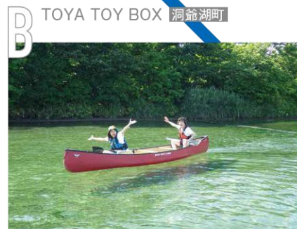
B TOYA TOY BOX 洞爺湖町