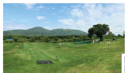
F 歴史公園夕日丘パークゴルフ場 洞爺湖町