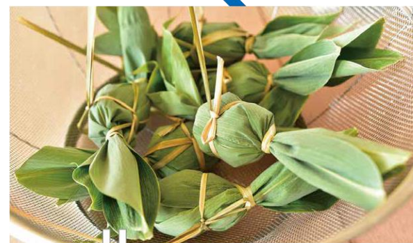
H 農家さんの伝統の味!笹だんごづくり 豊浦町