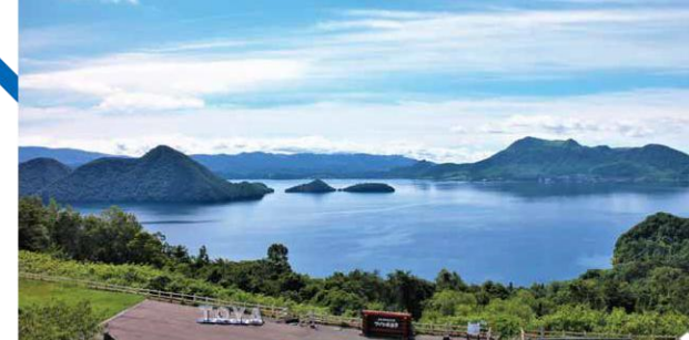
サイロ展望台 (ヘリコプター遊覧) 洞爺湖町