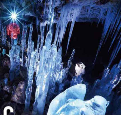
C 大滝アウトドアアドベンチャーズ 伊達市