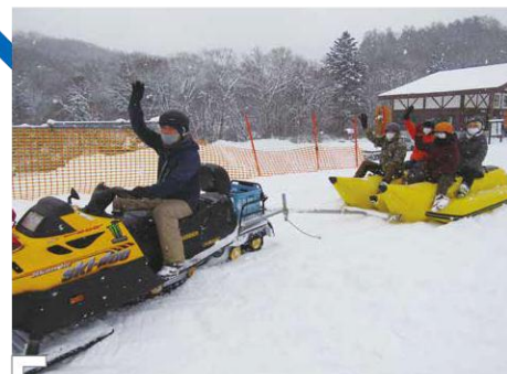
E オロフレスキー場 壮瞥町