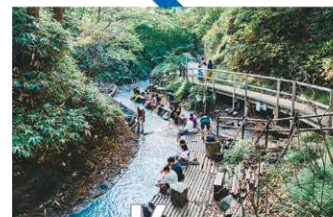
K 大湯沼川 天然足湯 登別市