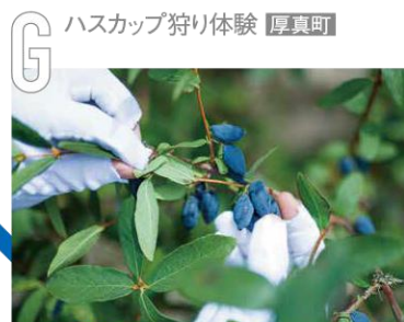
G ハスカップ狩り体験 厚真町