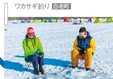
I ワカサギ釣り 白老町