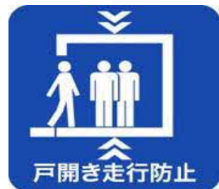
戸開走行保護装置設置済みマーク

本制度に関する詳細については、以下にお問合せください。 一般社団法人建築性能基準推進協会 電話：03-3513-7561 WEB： https://www.seinokyo.jp/