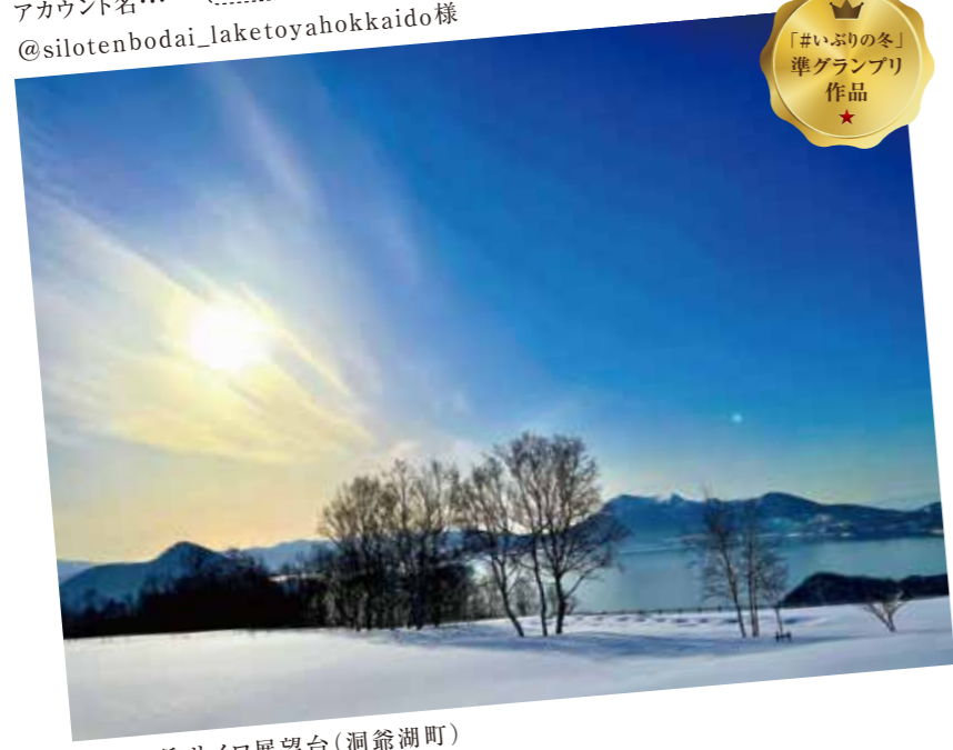
撮影場所:サイロ展望台(洞爺湖町)