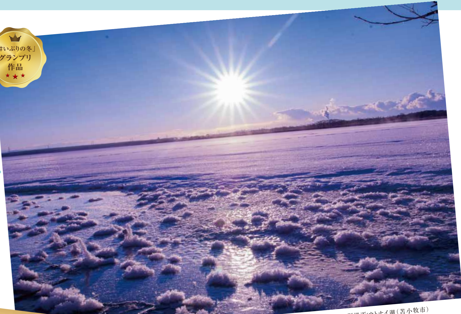
撮影場所:ウトナイ湖(苫小牧市) アカウント名...@kentaphoto2038様

冷え込みの激しい早朝のウトナイ湖に咲いた氷の花。顔を出した太陽の光を浴びて輝き出します。