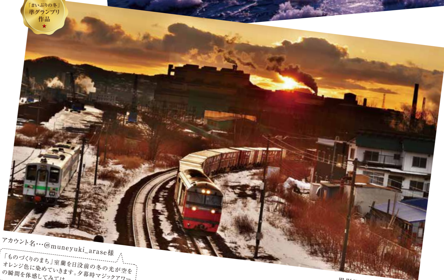
撮影場所:太平橋(室蘭市)

アカウント名...@muneyuki_arase様 「ものづくりのまち」室蘭を日没前の冬の光が空をオレンジ色に染めていきます。夕暮時マジックアワーの瞬間を体感してみてください。