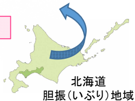
北海道 胆振(いぶり)地域