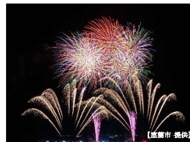
今年初めて開催された室蘭満天火花