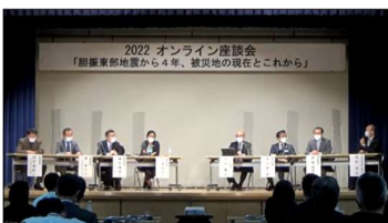
オンライン座談会 (厚真町)