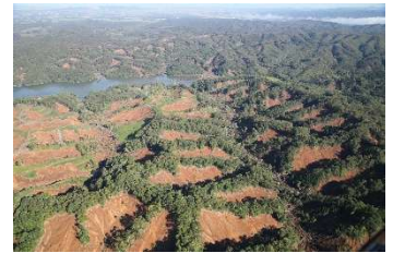
大規模な土砂崩れ (安平町)