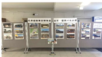
震災・復興パネル展 (室蘭市)