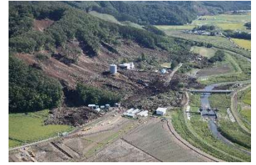
浄水場の被害 (厚真町)