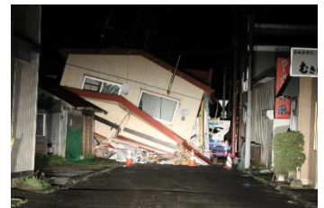
商店街の被害 (むかわ町)