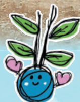
北海道植樹祭シンボルマーク 「芽森(めもりー)」