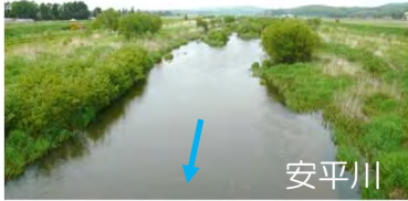
河道掘削等（胆振総合振興局）