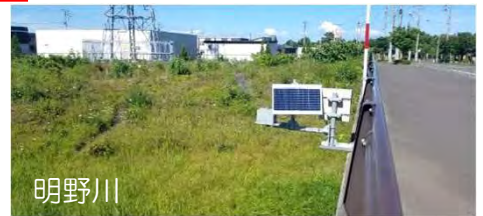
明野川 危機管理型水位計による観測データの提供（胆振総合振興局）