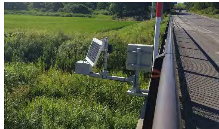
(ニタッポロ川) 危機管理型水位計による観測データの提供