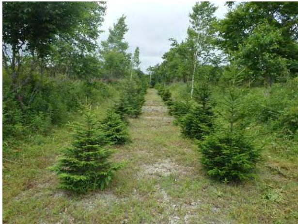
国有林内における植栽の実施 (胆振東部森林管理署)