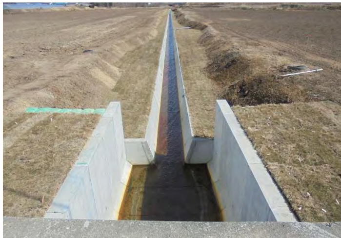
農業排水路の整備