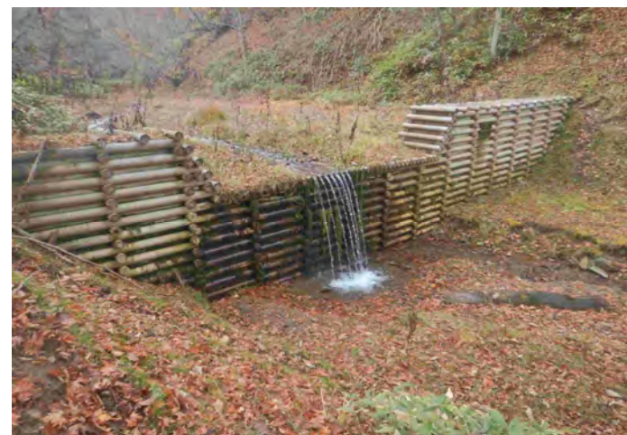
道有林内における治山ダムの整備