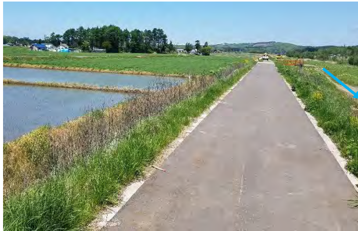
(安平川) 堤防天端舗装の実施

既存ダムにおける事前放流等の実施・体制構築 (室蘭開発建設部、胆振総合振興局、安平町、安平町土地改良区)