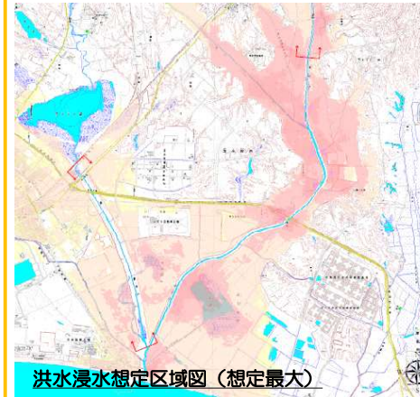
洪水浸水想定区域図(想定最大)

まちづくり等での活用を視野にした多段的な浸水リスク情報の検討 (胆振総合振興局)