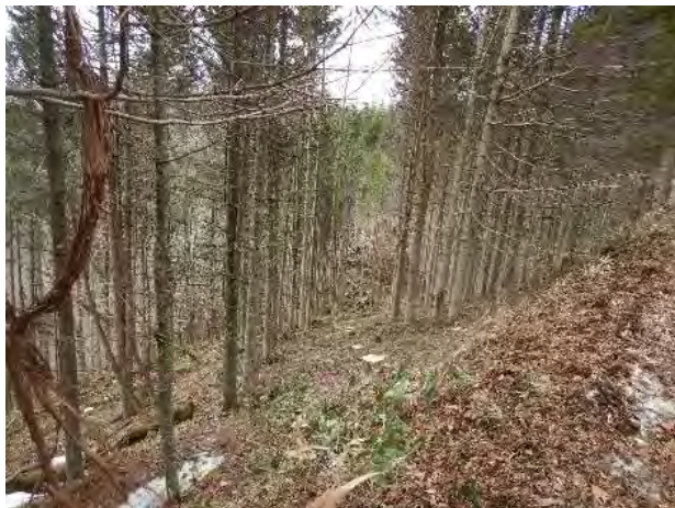
道有林内における間伐の実施 (胆振総合振興局)

まちづくり等での活用を視野にした多段的な浸水リスク情報の検討 (胆振総合振興局)