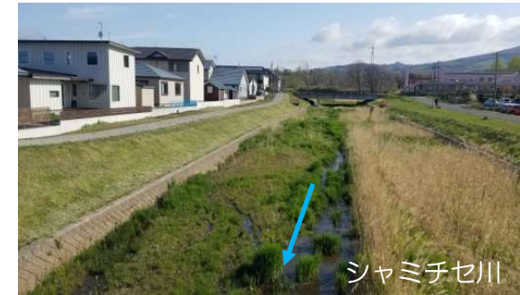
河道掘削等（胆振総合振興局）