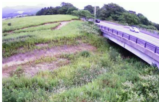
（シャミチセ川）簡易型河川監視カメラによる映像提供