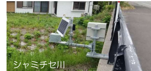
危機管理型水位計による観測データの提供（胆振総合振興局）