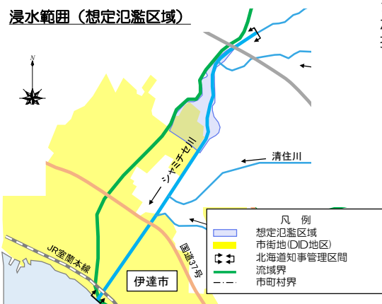
まちづくり等での活用を視野にした多段的な浸水リスク情報の検討 （胆振総合振興局）

シャミチセ川水系には水位周知河川 が無いいため、洪水浸水想定区域の 指定等を行っていない