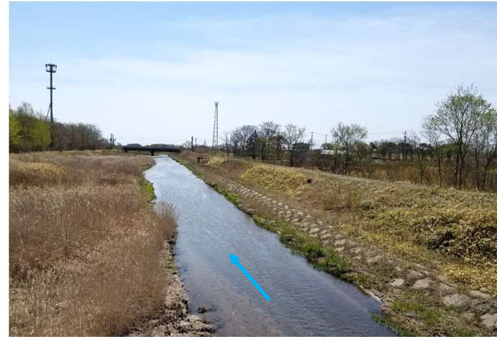
（ブウベツ川）河道掘削等の実施