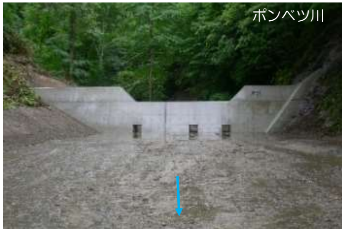
国有林内における治山ダムの整備 （胆振東部森林管理署）