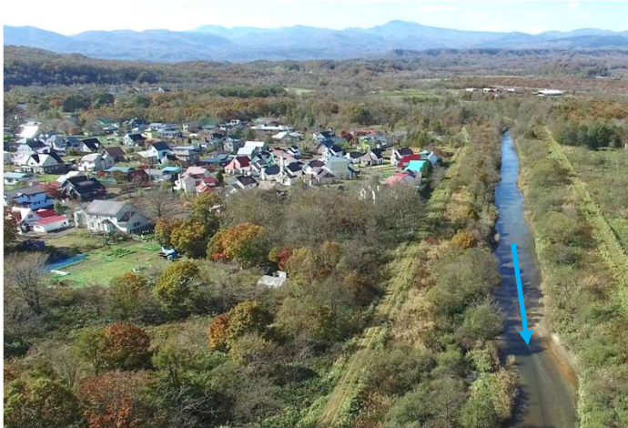
（ウヨロ川）河道掘削等の実施