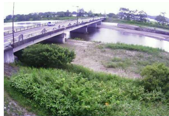
（白老川）簡易型河川監視カメラによる映像提供