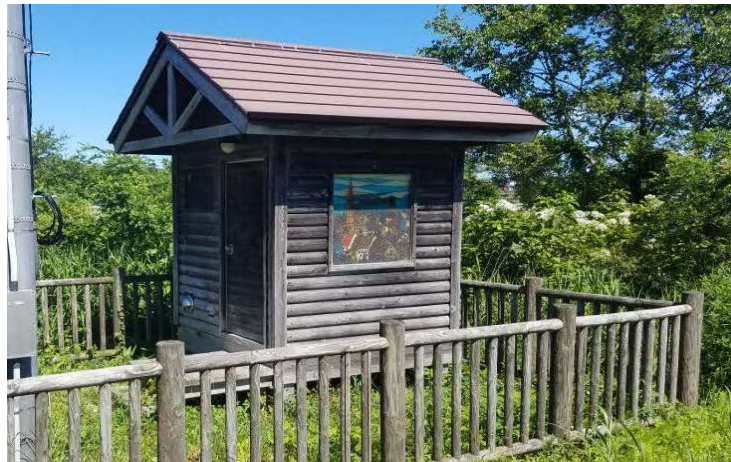
（白老川）水位観測データの提供