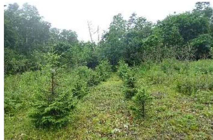
国有林内における植栽の実施 （胆振東部森林管理署）