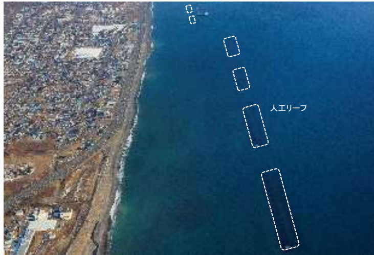
（胆振海岸）人工リーフの整備

まちづくり等での活用を視野にした多段的な浸水リスク情報の検討 （胆振総合振興局）