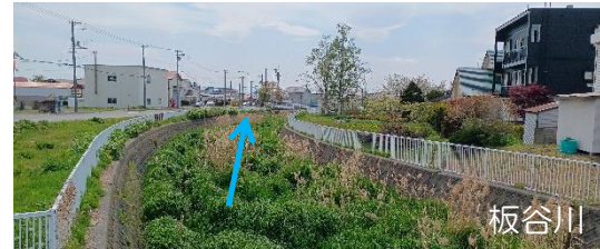
河道掘削、樹木伐採（胆振総合振興局） ※今後、関係機関と連携して対策を検討

■氾濫をできるだけ防ぐ・減らすための対策 ・河道掘削、樹木伐採 ・治山対策 ・森林整備 等