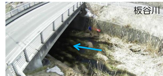
簡易型河川監視カメラによる映像提供（胆振総合振興局） ※今後、関係機関と連携して対策を検討

■被害の軽減、早期復旧・復興のための対策 ・簡易型河川監視カメラによる河川情報の提供 ・水害リスク空白域の解消に向けた取組 ・高潮浸水シミュレーション（想定最大規模）の実施・公表 等