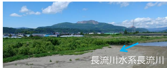
河道掘削、樹木伐採（胆振総合振興局）