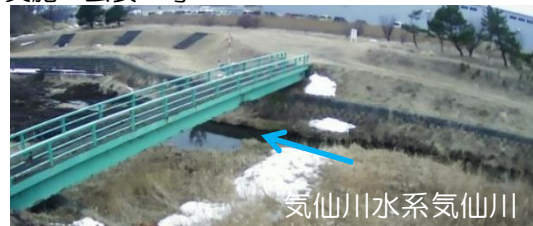
簡易型河川監視カメラによる映像提供（胆振総合振興局）