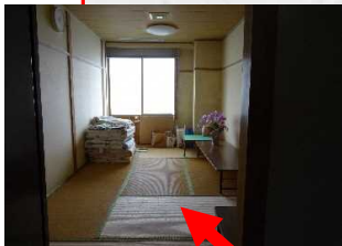
苫小牧合同庁舎 2階