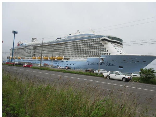
海外からの客船の入港【室蘭市】