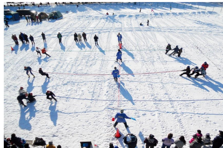
あつま国際雪上3本引き大会 (厚真町)