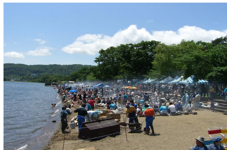
洞爺産業まつり（洞爺湖町）