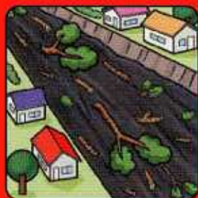
川の流が濁り流木が 混ざりはじめる