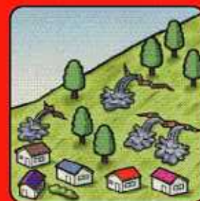
斜面から水がふき 出す