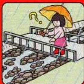
雨が降り続けているのに 川の水位が下がる