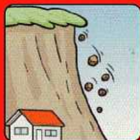
小石がパラパラ 落ちてくる