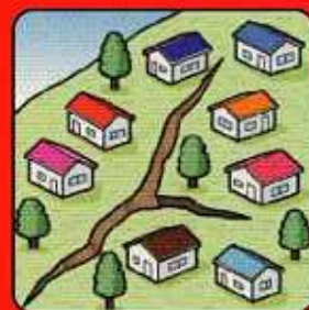
地面にひび割れが できる