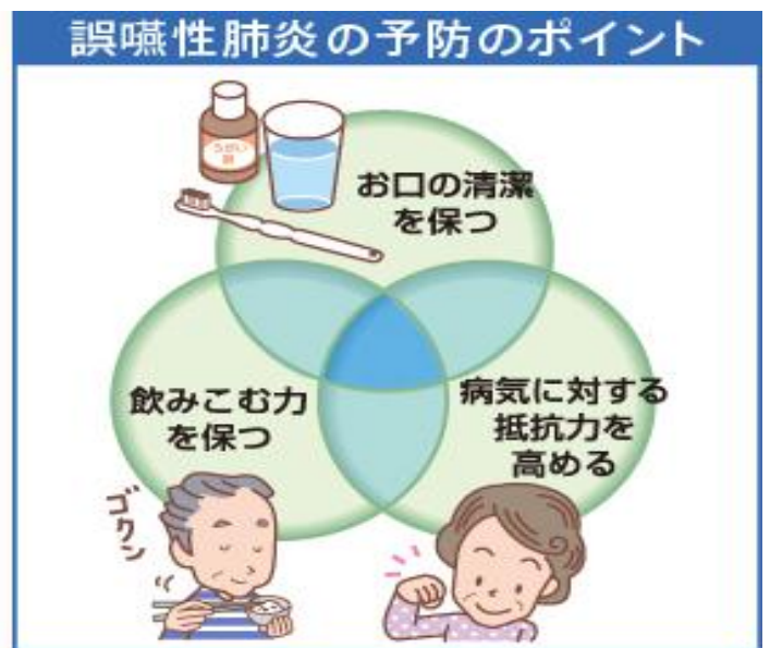
図：日本口腔保健協会ホームページより引用