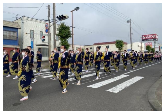
3年ぶりに開催されたむろらん港まつり【室蘭市】