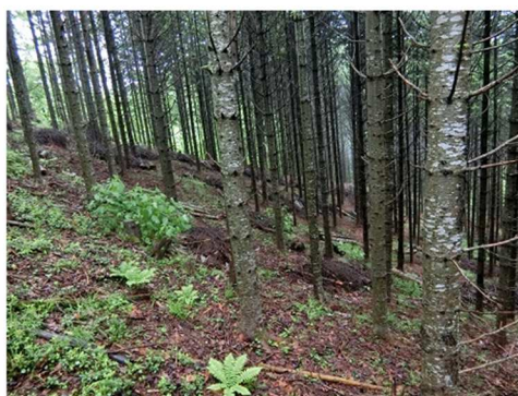
(H29年度の販売に供した森林)