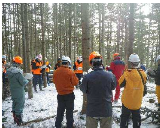
H29.1 現地検討会の様子

森林管理署とむかわ町は、共同で森林施業を実施できる可能性をもつ林地を森林共同施業団地に設定し、国有林材を2,060 m 3 、町有林材を450 m 3 を販売することで、受注した林業事業者において伐採量のまとまりができたほか、土場の共同利用による作設経費の削減、伐採作業機械の運搬や除雪をまとめてできることになり、作業コストの低減を図りました。