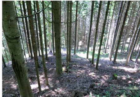
(H29年度の販売に供した森林)