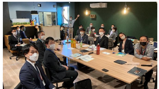
チームメンバー交流会