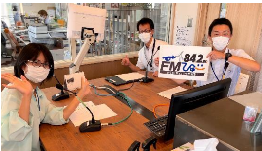
FMラジオ番組出演（月1放送+YouTube）