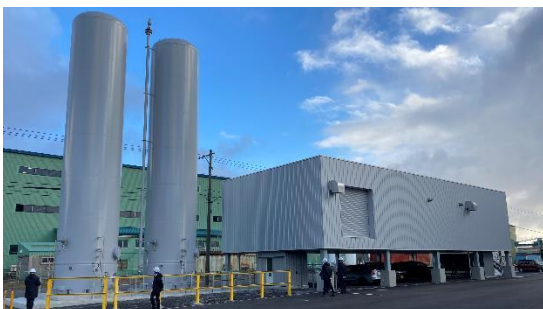
カーボンニュートラル工場見学 （いぶり水素倶楽部）