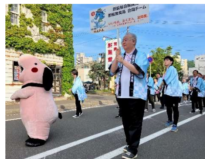
むろらん港まつり【室蘭市】